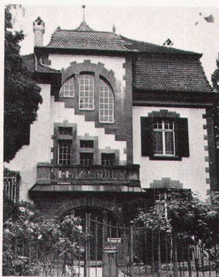
Villa Hirz, bodenweg 95, erbaut 1901 von Suter und Burckhardt. Vom Abbruch bedroht.

Mit Aufnahmen abgebrochener Häuser oder gefährdeter Bauten wirbt der Basler Heimatschutz auch dieses Jahr für die Stärkung des Denkmalschutzgedankens: es wird in Erinnerung gerufen, was