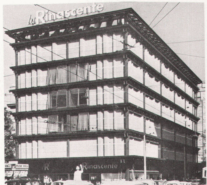
Franco Albini, Warenhaus Rinascente, Rom (1961)

Auskünfte: Comune di Milano, ripartizione cultura e spettacolo, Via Marlno 7, I-20121 Milano