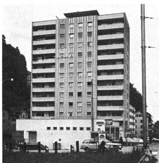
Wohnhochhaus in Luzern während der Sanierungsarbeiten. Die Metallunterkonstruktion «Aluhit-F» ist bereits angebracht, und mit der Montage der Platten wurde oben links begonnen.

Ein interessantes, weil sehr einfaches System, das auch der Preissituation des heutigen Baumarktes gerecht wird, hat die Firma Wyss AG Littau entwickelt und unter dem Namen «Aluhit-F» auf den Markt gebracht. Die Konstruktion besteht aus stranggepresstem Aluminium und überwindet mühelos Wandabstände von 60 mm bis 150 mm. Das Befestigungsmaterial ist rostfrei.