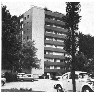
Mehrfamilienhaus «Kottenfirst» in Sursee nach der Sanierung mit farbigen Platten «Pelichrom».

Durch stufenloses Einstellen der Ausgleichsträger kann die Unterkonstruktion äusserst genau ausgerichtet und justiert werden. Für die Fensteranschlüsse wurde ein Spezialprofil entwickelt, das vor allem bei Fassadensanierungen gestattet, Fenster- oder Türleibungstiefen zu verkürzen oder zu verlängern. Diese Leibungs-