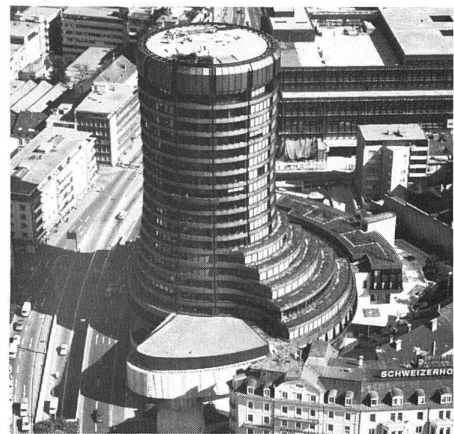
BIZ Basel, 1800 m² Sarnafil

Darum haben wir ein System , das auf dem Dach keine Fragen offenlässt – und alle Abdichtungsprobleme löst. Darum haben wir eigene Produktionsverfahren