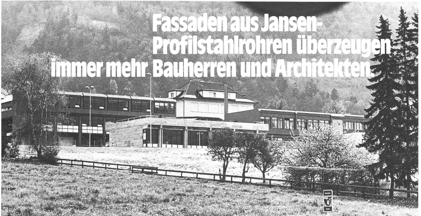
Volksschule Ebenholz, Vaduz FL

Wenden Sie sich an unseren erfahrenen technischen Beratungsdienst.