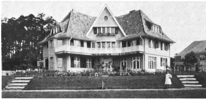
2 Hermann Muthesius, Landhaus, Berlin-Nikolassee, 1913 (abgerissen)

Geschichte sein kann. Denn: Muthesius sammelt und verwertet, ist englisches Mittelalter und seine schöpferische Neuentdeckung seit 1860. Muthesius entdeckt darin – geradezu sozialwissenschaftlich – das Verhalten, das dieser Architektur zugrunde liegt: Understatement, ungewollene Umgangsformen, bestimmte Normen. Er beobachtet die Freiheit, wieder bestimmte menschliche Bedürfnisse zu entfalten, sie vernünftig zu disponieren und abzugrenzen – und gleichzeitig vielen Normen des Standes weiterhin zu folgen. Das