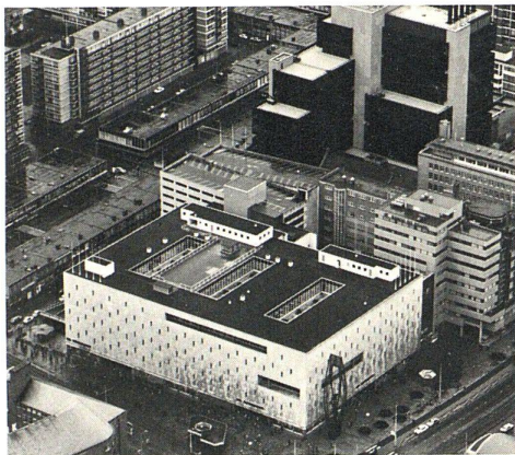
Zum Beispiel Rotterdam par exemple