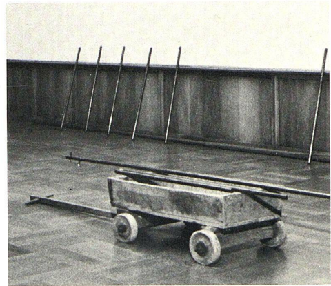
Kunstvermittlung und Avantgarde et critique d'art