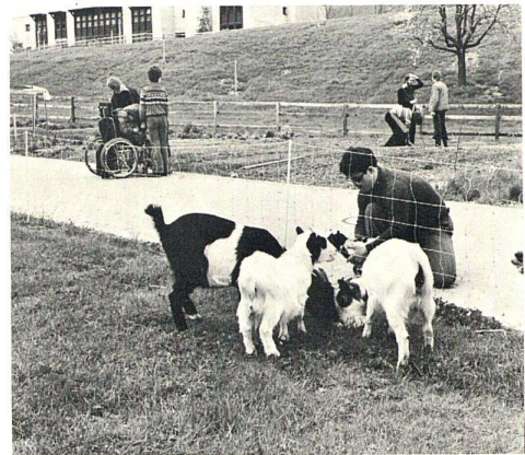
Bauen für Behinderte Construire pour les handicapés