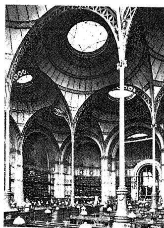
Bibliothèque Nationale, Paris (1854-1875)

Département d'architecture, EPF-L, Avenue de l'Eglise Anglaise 12, Lausanne.