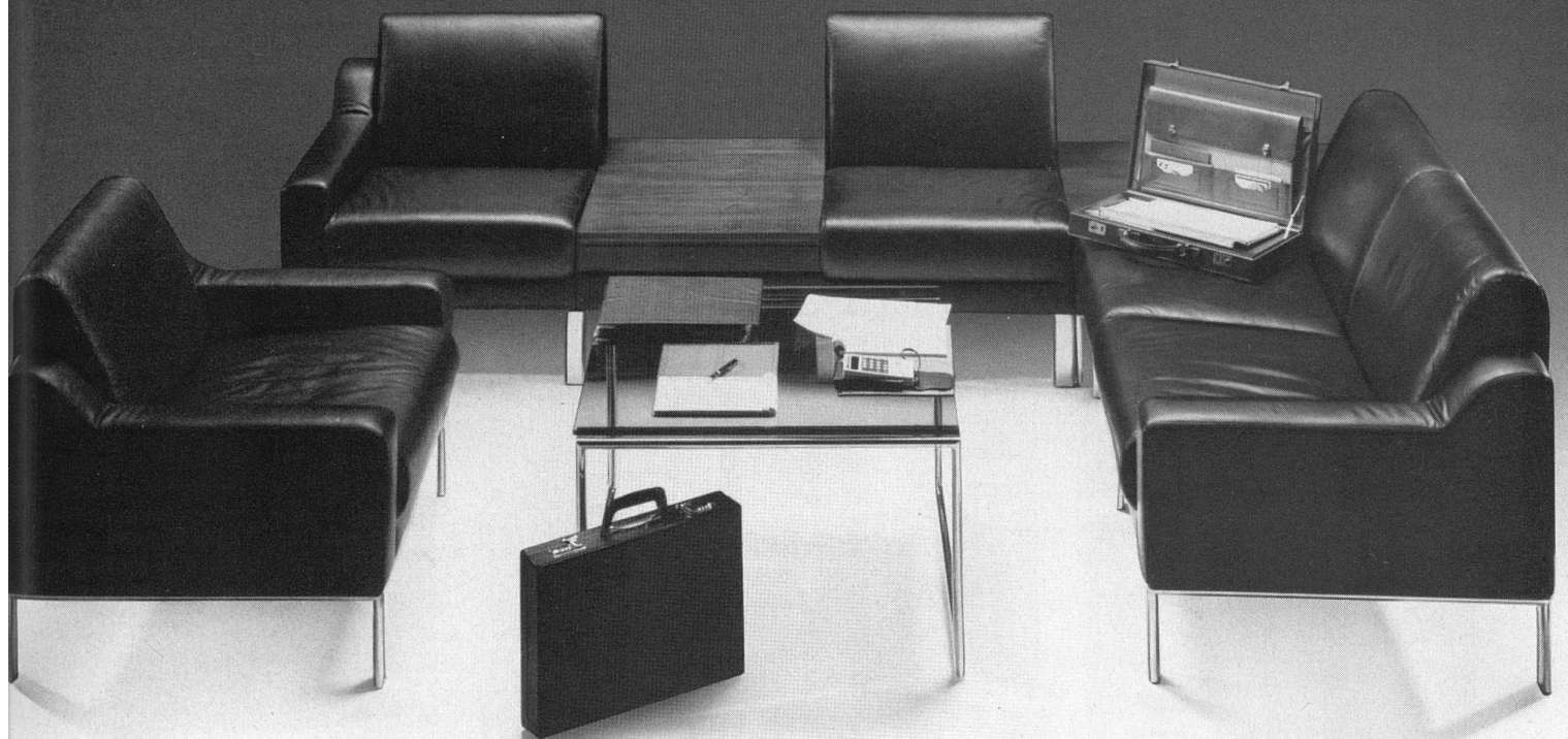
Modell »Club« von Züco.

Club ist gediegen verarbeitet, bietet überdurchschnittlichen Sitzkomfort. Lieferbar in den Bezugsmaterialien Stoff und Leder. Variierbar, kombinierbar – paßt sich den Räumlichkeiten an.