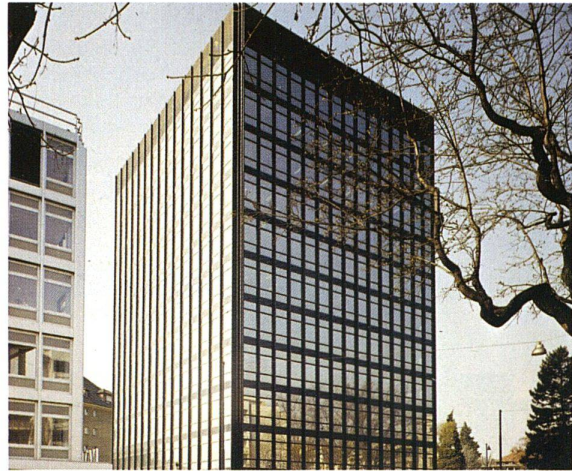
Radio Schweiz, Bern; Architekt: F. Geiser, Bern