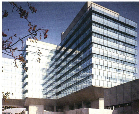
GENO-Haus, Stuttgart; Architekten: Prof. Kammerer/Prof. W. Belz, Stuttgart

Der Ausblick auf Ihre Aussicht lohnt sich: Weil CALOREX® absolut farbneutral spiegelt, haben Sie jetzt beträchtlich mehr gestalterische Freiheit. Denn dieses hell spiegelnde Sonnen-Reflexionsglas harmoniert mit allen Außenverkleidungen in jeder Umgebung.