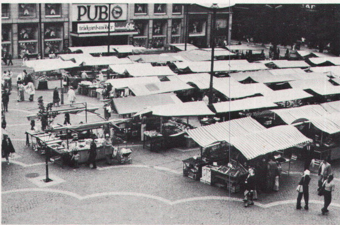
4 Überlieferter Wochenmarkt auf Stockholms Heumarkt, dessen Funktion heute mehr folkloristischer und touristischer Natur denn jene eines Versorgungsmarktes ist