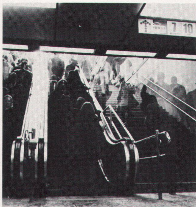
7 Ab- und Aufgang zu «Shop-Ville», Zürichs Einkaufsstadt im Untergrund, wo aus Passanten Konsumenten gemacht werden