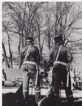
9 Mit Polizeieinsatz werden die Bäume heute nicht vor Baumkillern...