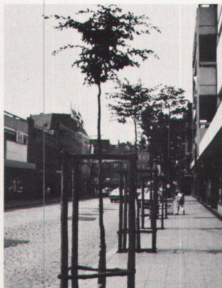
8 Mit grossem (Schutz-) Aufwand werden dafür, wie hier in Berlin-Tegel, neue Bäumchen gepflanzt, die die altgewachsenen Bäume nie ersetzen und die den Trottoirparkieren bald ein Ärgernis sein werden