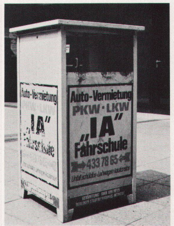
6 Immer öfter dient das Strassenmobiliar als zusätzliche Einnahmequelle in Form von Werbeträgern. Solche Abfallmöbel stehen zu Hunderten in ganz Berlin herum