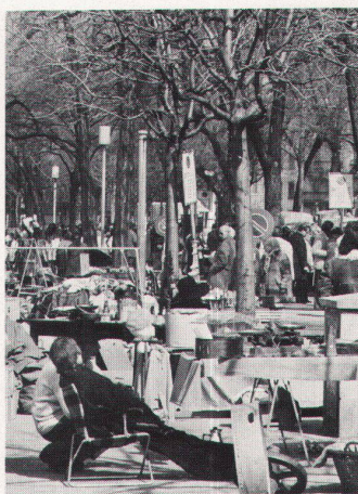
5 Installierung eines Antiquitätenmarkts in der Genfer Avenue Henri-Dunant nicht aus Versorgungsnotwendigkeit, sondern als Teil des Stadtwiederbelebens- und Touristenprogramms