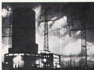
En ce qui concerne la construction de centrales nucléaires produisant de l'énergie électrique, le blocus arabe sur le pétrole nous a fait gagner dix ans. (La centrale atomique de Jülich, en Allemagne fédérale. Sirman-Press.)

Was den Bau von stromerzeugenden Kernkraftwerken betrifft, so hat uns der arabische Ölboykott um 10 Jahre vortwärtsgebracht. (Atomkraftwerk Jülich in der Bundesrepublik. Sirman-Press)