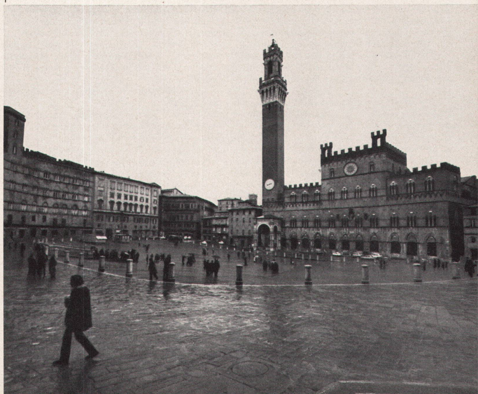
1 Piazza del Campo in Siena nach Einführung der Fußgängerzone