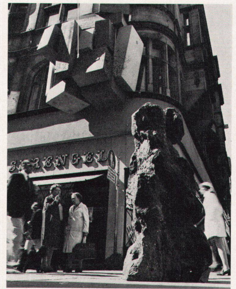
4 Farbkuben von Roland Goeschl