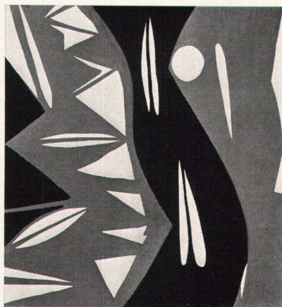
Ernst Wilhelm Nay, Nr. 9 – rot – weiß – schwarz II, 1967