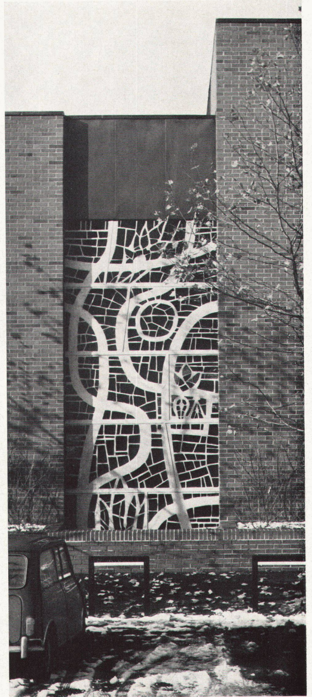
7 Das Glasfenster von innen Le vitrail vu de l'intérieur The stained glass window from inside