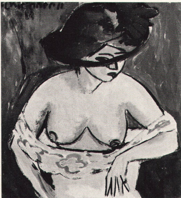
1 Ernst Ludwig Kirchner, Weiblicher Halbakt mit Hut, 1911. Wallraf-Richartz-Museum, Köln

se mit beschränkter Teilnehmerzahl zur Behandlung von kunstwissenschaftlichen Spezialfragen nach Riggisberg einzuladen. Auch dafür stehen die notwendigen Räumlichkeiten in einem vorzüglich eingerichteten Vortragssaal und einem kleinen Ausstellungsraum für Wechsellausstellungen in dem angenehmsten Ambiente zur Verfügung. Auch von dieser Aktivität verspricht sich das Institut fruchtbare Ergebnisse und vor allem eine ergiebige wissenschaftliche Zusammenarbeit über die Grenzen der Länder hinweg. Für junge schweizerische Kunstwissenschaftler und Archäologen bietet das Institut gerade von da her neue und überaus interessante Möglichkeiten. Daß durch private Munifizienz unser Land nicht nur um eine einzigartige Sammlung, sondern auch um ein fortschrittlich eingerichtetes wissenschaftliches Institut bereichert worden ist, hätte, so scheint es, mehr Beachtung und Anerkennung verdient. Um so mehr, als es sich bei der Abegg-Stiftung nicht um die einmalige Geste eines Geschenkes handelt, sondern darüber hinaus um die stauenswerte Bereitschaft, ohne irgendwelche wirtschaftliche Nebenabsichten auf Jahre und Jahrzehnte hinaus den Betrieb eines Instituts zu tragen, das heute schon seine immerhin anderthalb Dutzend Mitarbeiter zählt. Willy Rotzler