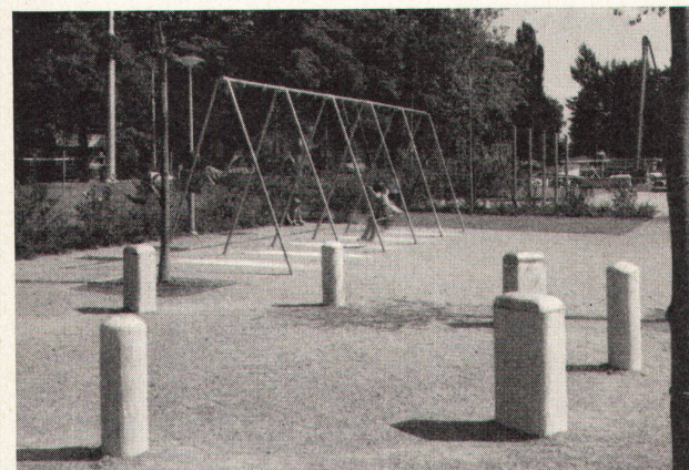
6 Die SAFFA-Insel am linken Seeufer, heute ein verlassenes Eiland