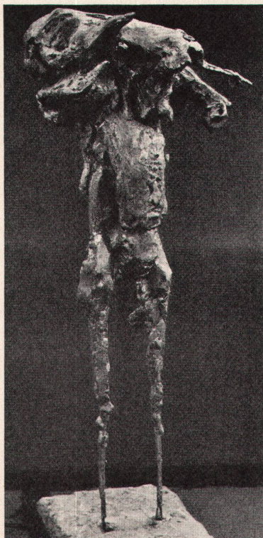
4 Barbara D. Chase, Man and Goat, 1960. Gips