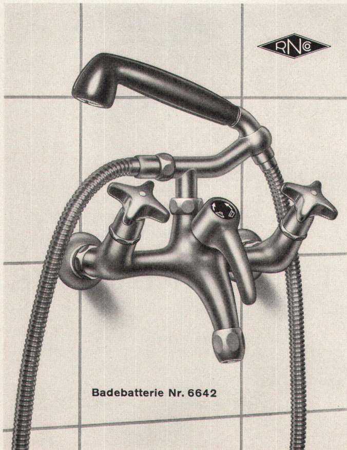
Badebatterie Nr. 6642

Brunner & Cie., Lenzburg E. Dillier, Sarnen Ganz & Co. Embrach AG, Embrach Ofenfabrik Kohler AG, Mett-Biel Gebrüder Kuntner, Aarau Gebrüder Mantel, Elgg