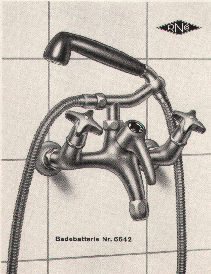
Badebatterie Nr. 6642

Zürich 3/45 Eichstr. 23 Tel. (051) 35 33 93 Zürich 8 Othmarstr. 8 Tel. (051) 32 88 80 Basel Clarastr. 17 Tel. (061) 32 96 06