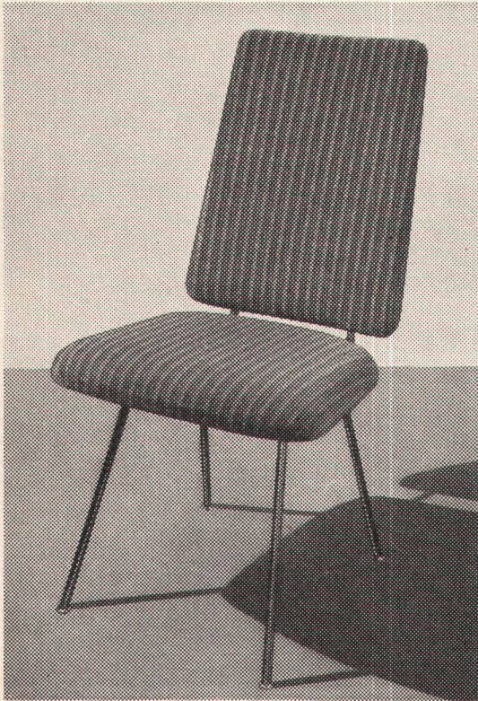
Modell 586 ges. gesch.

Altorfer AG Abt. Metallmöbel Zürich 1 Löwenstraße 32 Telephone (051) 25 07 47