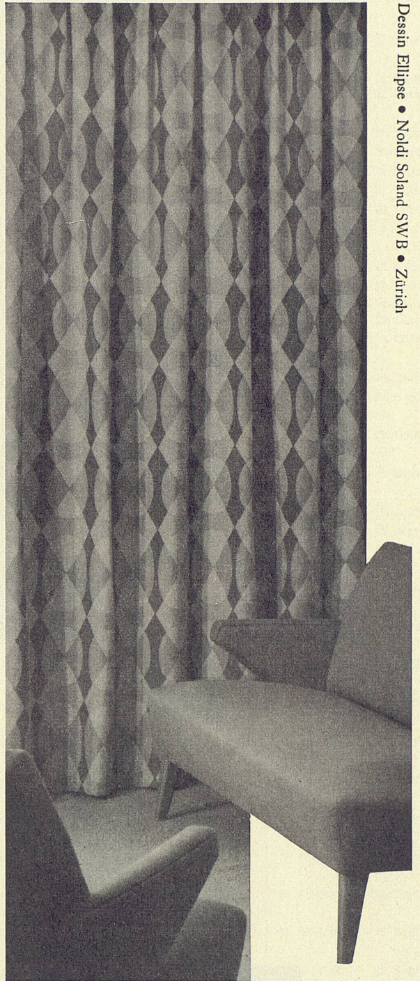
Dessin Ellipse • Noldi Soland SWB • Zürich

Bürgin & Cie. GmbH, Schaffhausen Metallwarenfabrik Telefon 053 / 5 42 66