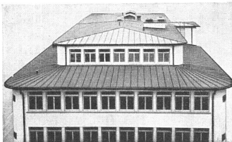
Spenglerarbeit: Blechdach (Kupfer)