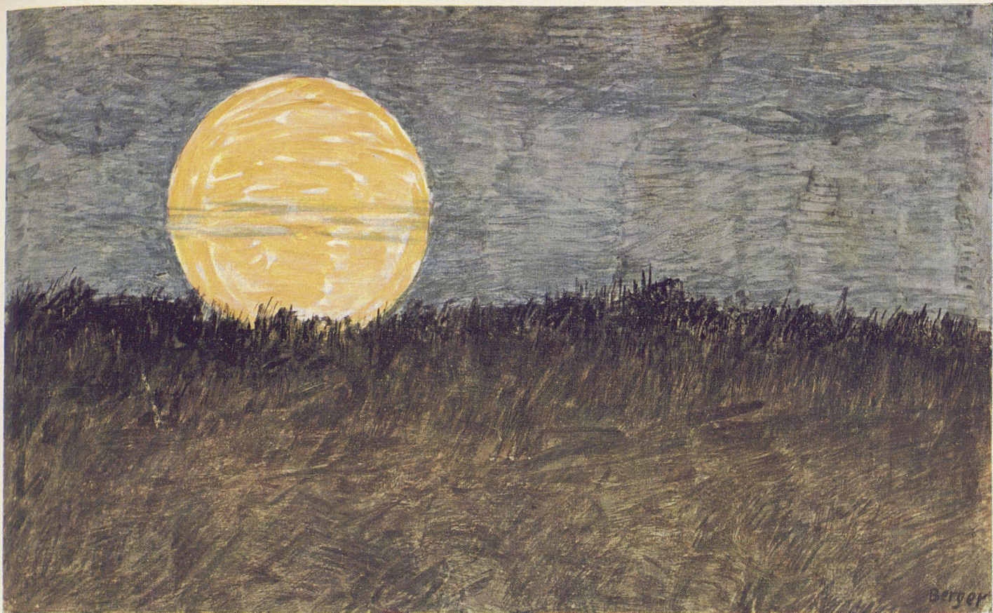
Hans Berger, Lever de lune , 1949 | Aufgehender Mond | Rising Moon