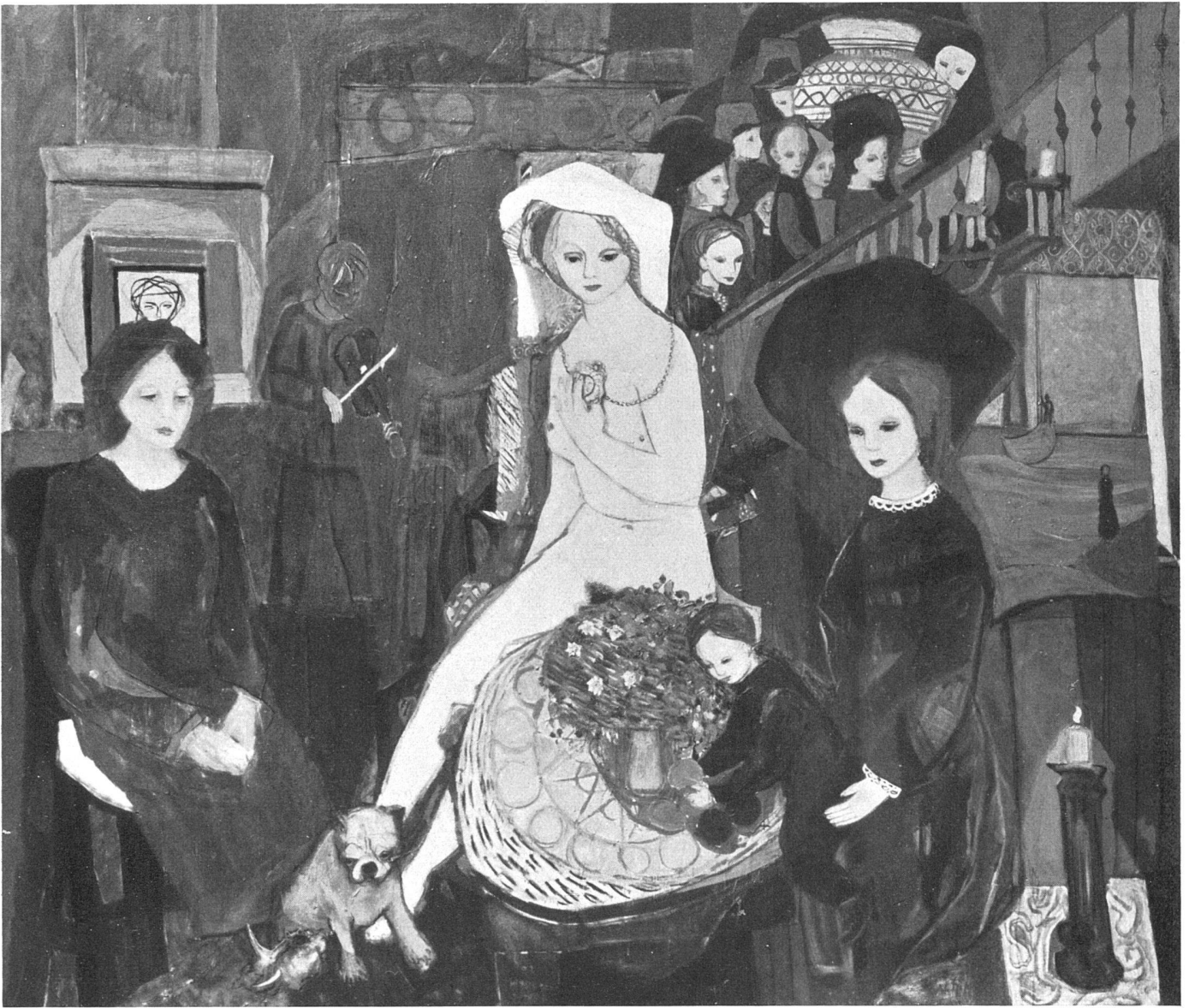
Kai Fjell, Witwe , 1942 | La veuve | Widow