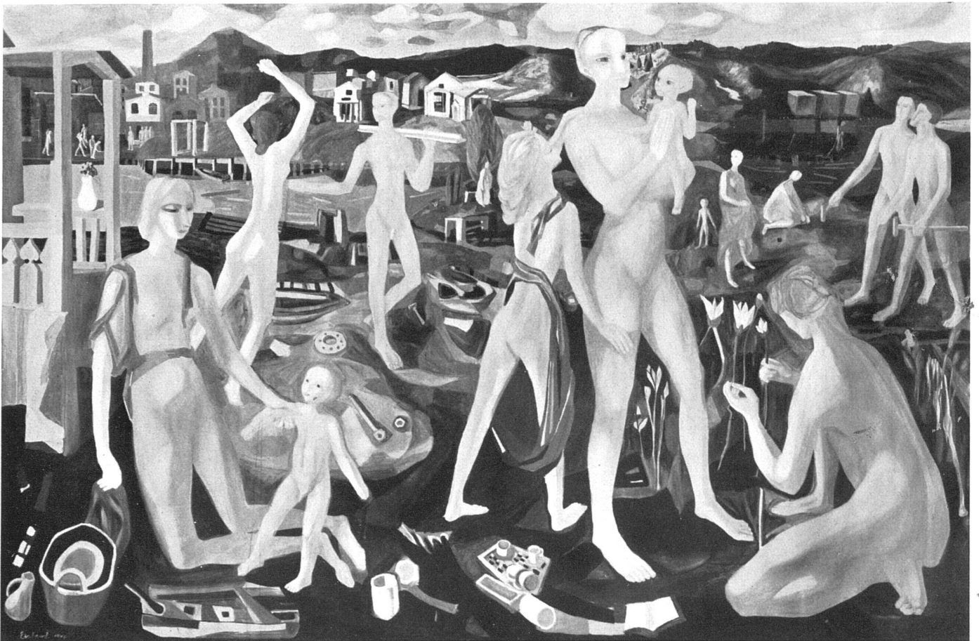
Arne Ekeland, Frühling , 1942 | Printemps | Spring