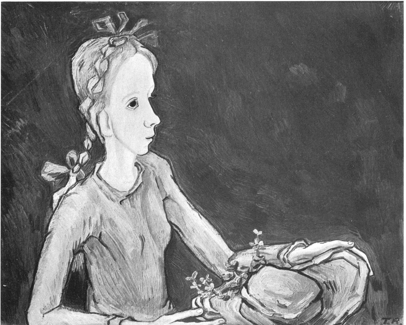
Teddy Røwde, Mädchen mit gelbem Hute, 1947 | Jeune fille au chapeau jaune | Girl with yellow hat