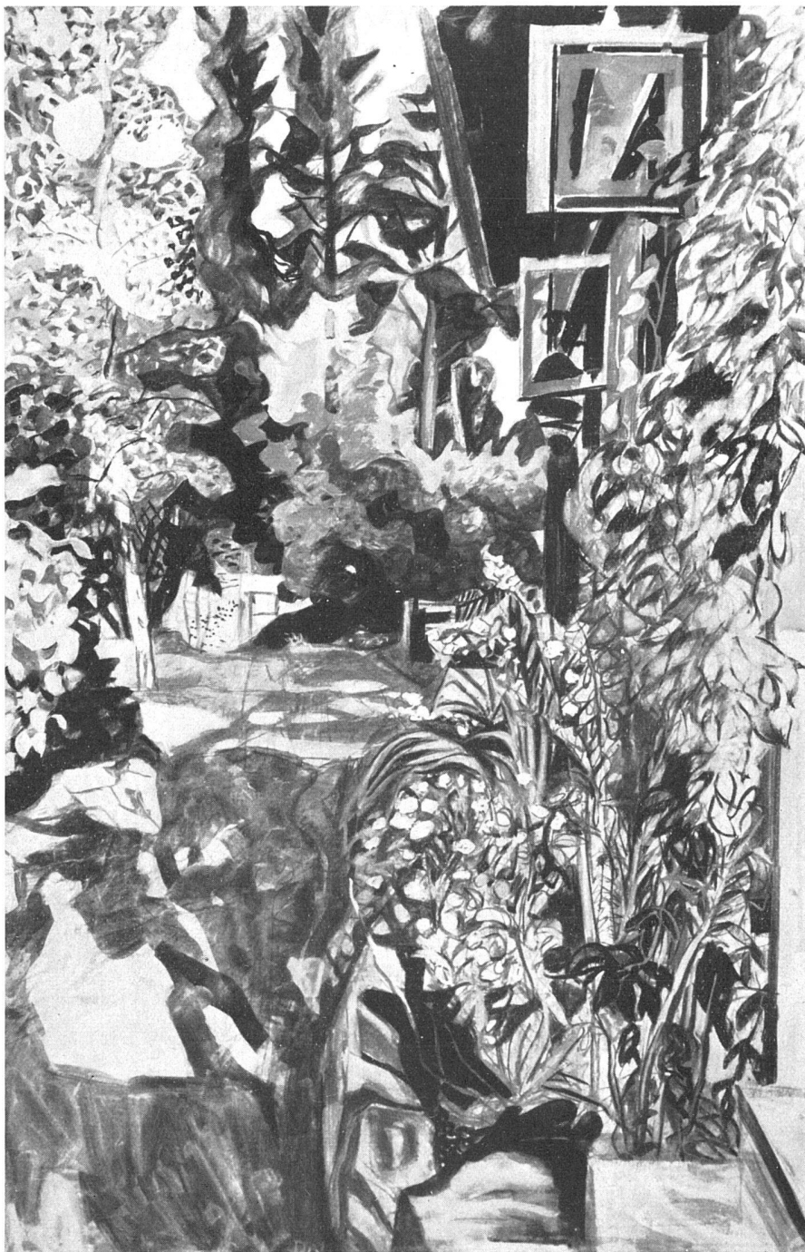
Harald Dal, Garten auf Nesodden, 1943. Gouache | Jardin à Nesodden; gouache | Garden at Nesodden. Body-colour