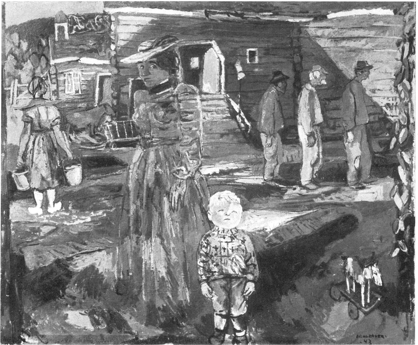
Erling Enger, Alter Hof , 1943 | Vieille ferme | Old farm