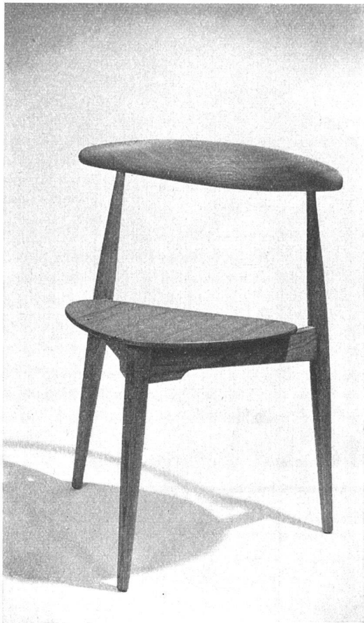
Mod. Nr. 4103 / Fritz Hansens, Eftfl. Kopenhagen