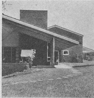
Wohnhaus in Niederweningen Architekt: Ernst Gisel BSA, Zürich

Wohnhaus in Küsnacht. Architekten: Dubois & Eschenmoser BSA/SIA, Zürich