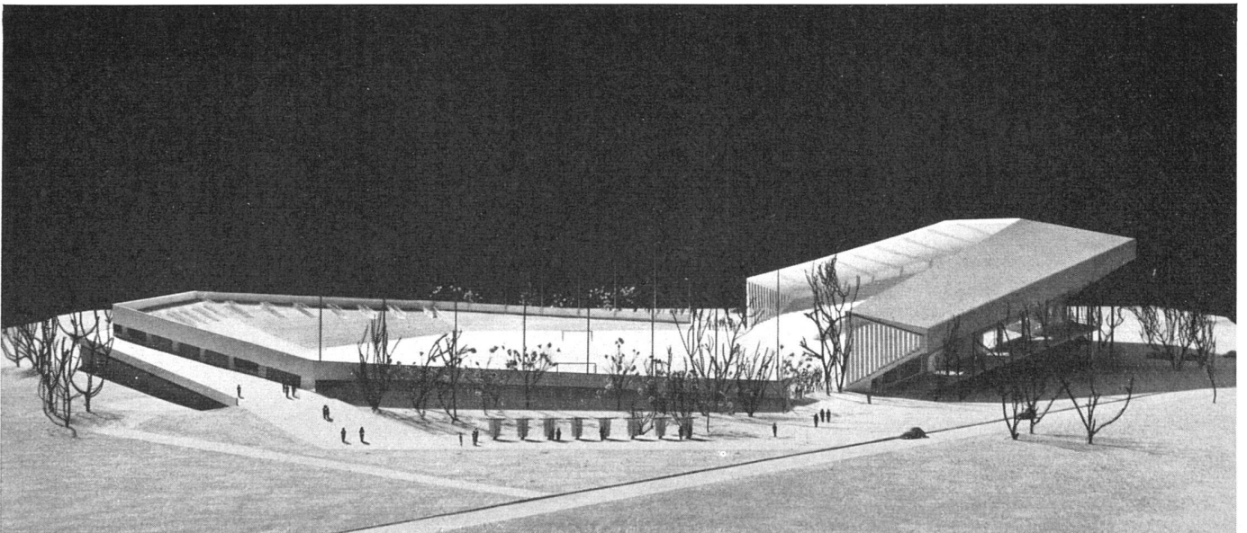
Modellansicht von Süden | La maquette vue du sud | The model seen from the south

Projekt «Oktogon», erster Preis des Wettbewerbs für ein Großstadion in Zürich-Altstetten, 60 000 Plätze Prof. Dr. W. Dunkel, Arch. BSA/SLA und J. Dahinden, Arch. ETH, Zürich Ingenieure Gebr. Tusch Schmid AG., Zürich