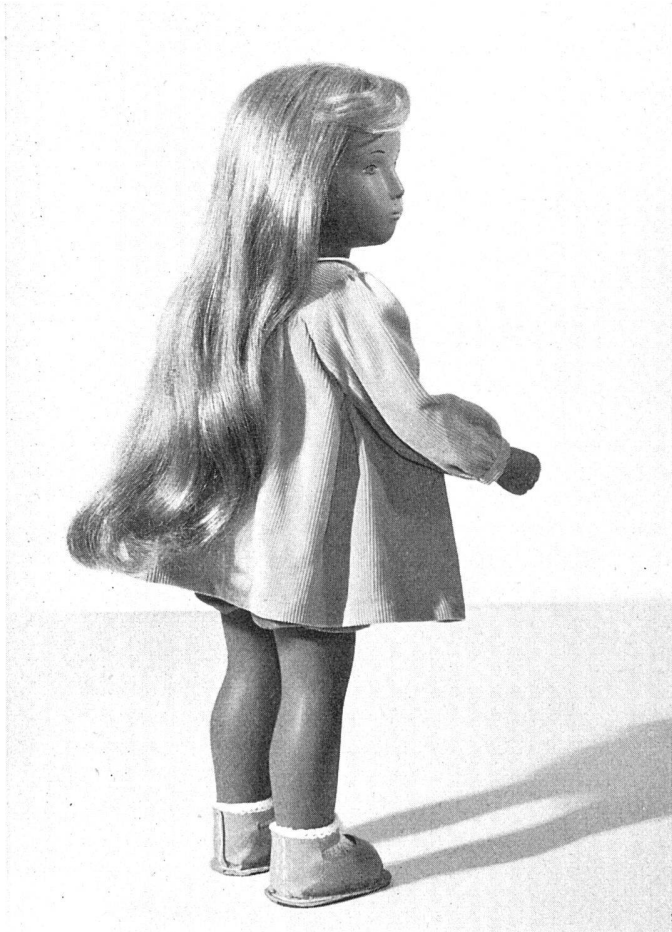
Sasha Morgenthaler, Puppe mit Goldhaar, 1951. Rock in gleichem Farbton, Höhe 50 cm | Poupée à cheveux or, robe de même ton | Doll with golden hair. Skirt same tint

wuchern. Ihr Haus ist wie ihr Garten; alles ist hell, alle Farben sind froh und stehn so zueinander, wie nur ein Künstlerauge sie anordnet.