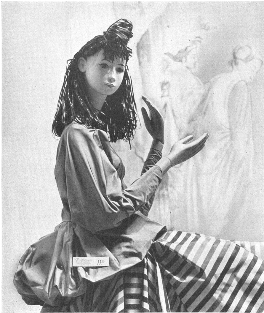
Sasha Morgenthaler, Marionetten-Mannequin mit Cellophanhaar, 1948, für Firma Jelmoli S. A., Zürich. Gleiches Material wie Puppen, Höhe 2,50 m | Mannequin marionette aux cheveux de cellophane | Marionette-mannequin with cellophane hair