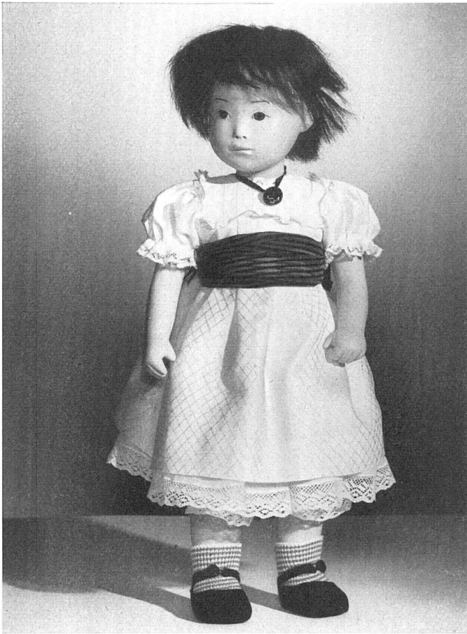
Sasha Morgenthaler, Puppe nach einem Daguerreotyp, in eigener Werkstatt hergestellt (Handarbeit). Hartmasse mit eingegossenen Stofflagen | Poupée d'après un daguerreotype | Doll after a daguerreotype