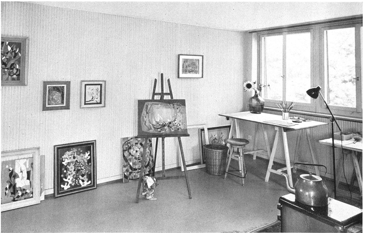
Das Atelier von Elsa Burckhardt-Blum | L'atelier d'artiste | The artist's studio