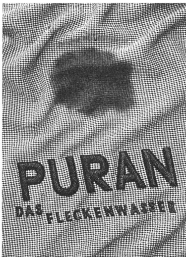
Prämiierte Plakate 1950 Wolfgang Lüthy, Basel