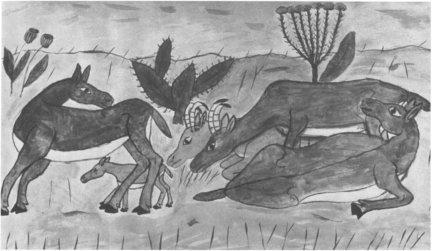
Carl Th., Ruhende Antilopen (1946). Deckfarbenmalerei | Antilopes au repos (1946); gouache | Reclining Antilopes (1946); gouache painting

dringt im besten Fall zu einer bescheidenen bildnerischen Tätigkeit durch, oder er dilettiert weiter, oft selbstzufrieden mit seiner pseudokünstlerischen Leistung. – Der Dilettant ist auf bildnerischem Gebiet (im Gegensatz zum musikalisch reproduktiven) eine tragische Erscheinung, die zur Gefahr wird, wenn sie anspruchsvoll oder gar anmaßend auftritt.