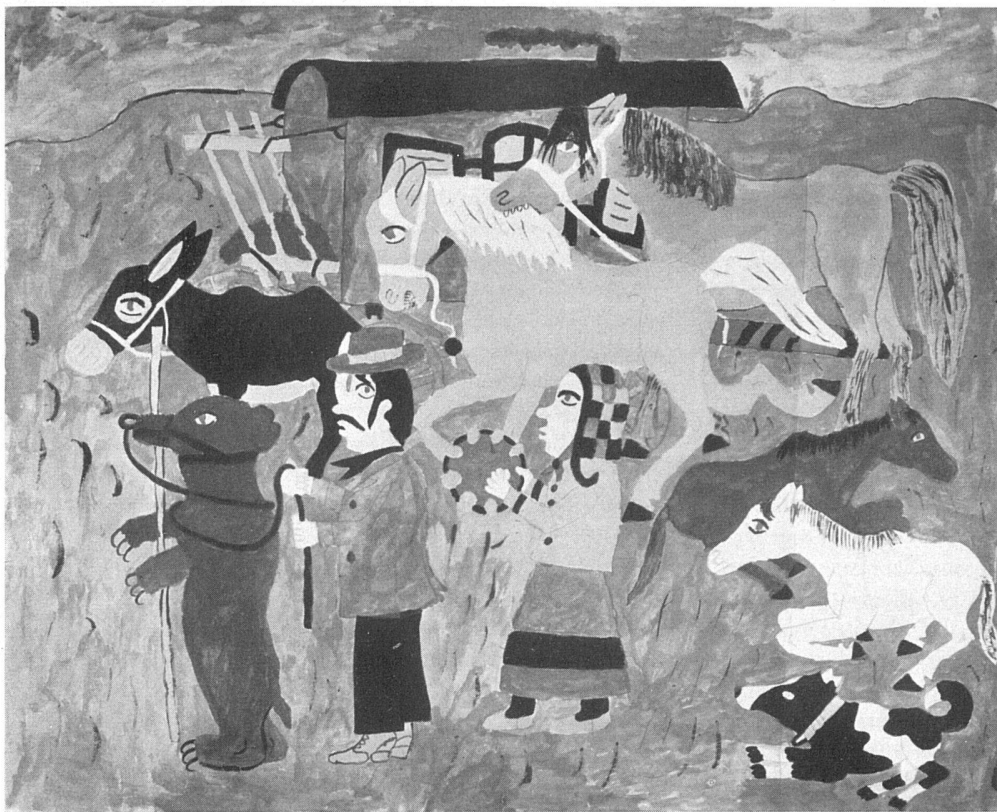
Laienmalerei der Gegenwart: Zigeunerfamilie (1950). Deckfarbenmalerei des Gelegenheitsarbeiters Carl Th., geboren 1882 | Peinture naïve contemporaine: Famille de bohémiens (1950) Gouache du journalier Carl Th., né en 1882 | Amateur Painting of To-day Gipsy Family (1950). Gouache painting of the day-labourer Carl Th., born 1882

blaue, rote, gelbe und buntgetupfte Pferde, Clownerien, biblische Stoffe, Szenen aus Sensationsfilmen. Immer sind seine Bilder überzeugende Kompositionen voll formaler und farbiger Sicherheit. Th. hat seine Freude nur in seiner Tätigkeit. Als eine Sammlung seiner Aquarelle in Hamburg ausgestellt wurde, weigerte er sich hinzugehen. Er erklärte, daß er sie ja gemalt habe und sie darum nicht zu sehen brauche. – Th. ist völlig unbeeinflussbar. Er interessiert sich weder für «Kunst» noch für Kritik. Er ist das Beispiel eines typischen Laien. Er liebt Tiere und Kinder. Die Menschen beurteilt er nach der Stimme seines einfältigen Herzens. Unbekümmerte Herzlichkeit, Farben und Papiere sind ihm lieber als Geld und gute Worte.