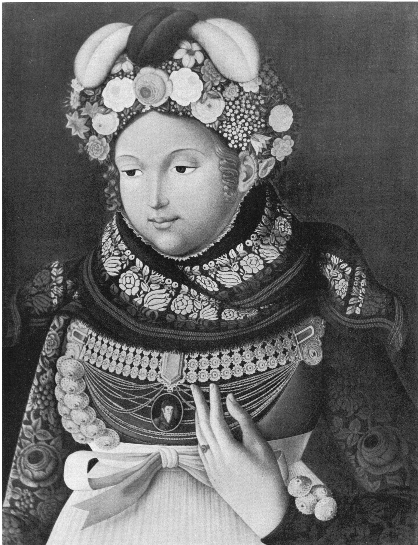
Aus den Anfängen der Laienmalerei: Braut auf Föhr. Ölbild des Schullehrers Oluf Braren (1787–1839) | Début de la peinture d'amateur: Fiancée de l'île de Föhr. Tableau à l'huile de l'instituteur Oluf Braren (1787–1839) | From the beginnings of Amateur Painting: Bride from the Isle of Föhr. Oil Painting of the school teacher Oluf Braren (1787–1839)