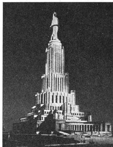
Definitives Projekt für den Palast der Sowjets in Moskau. Architekten: B. Jofan, V. Gelfreich, V. Schtuzcko. Aus: Architektura CSR, Prag, Mai/Juni 1950