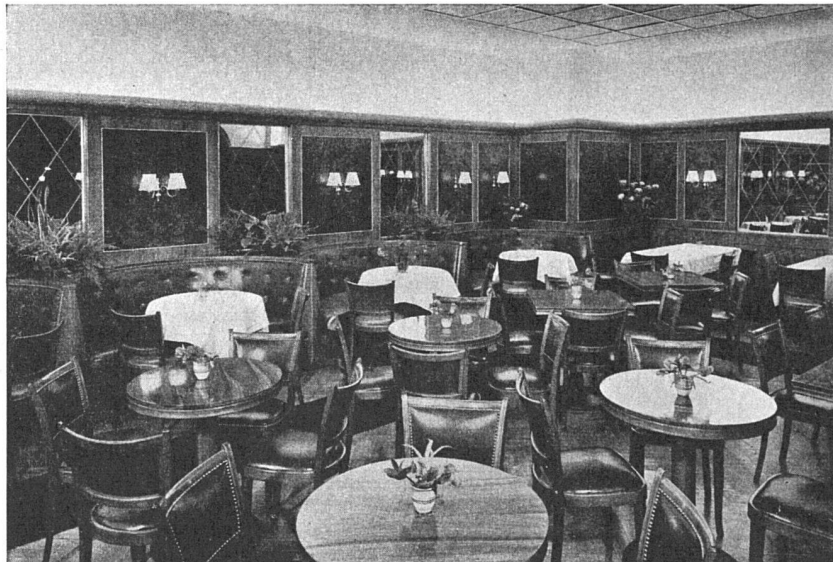
Café Singer Basel, beim Bahnhof

Überall, wo hohe Ansprüche an die Schönheit und die Qualität gestellt werden, verwenden Sie mit Vorteil BOLTAFLIX.