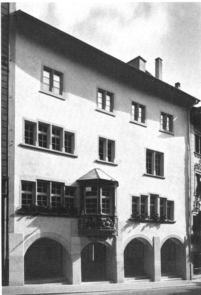
Fassade gegen die «Oberstadt» nach dem Umbau | L'ancienne façade après la restauration | Ancient elevation after restoration