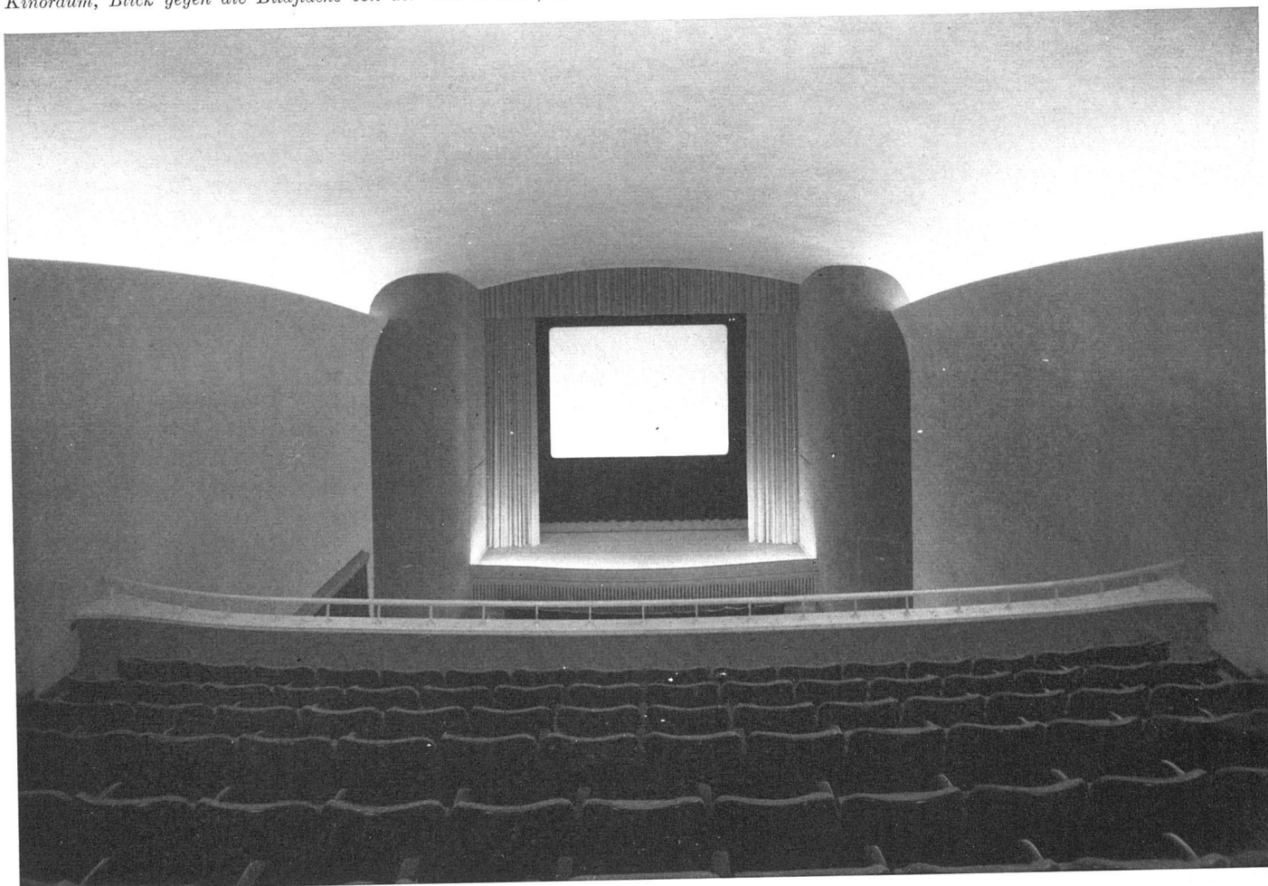
Kinoraum, Blick gegen die Bildfläche von der Galerie aus | La salle de cinéma vue de la galerie | Cinema interior, view from the gallery