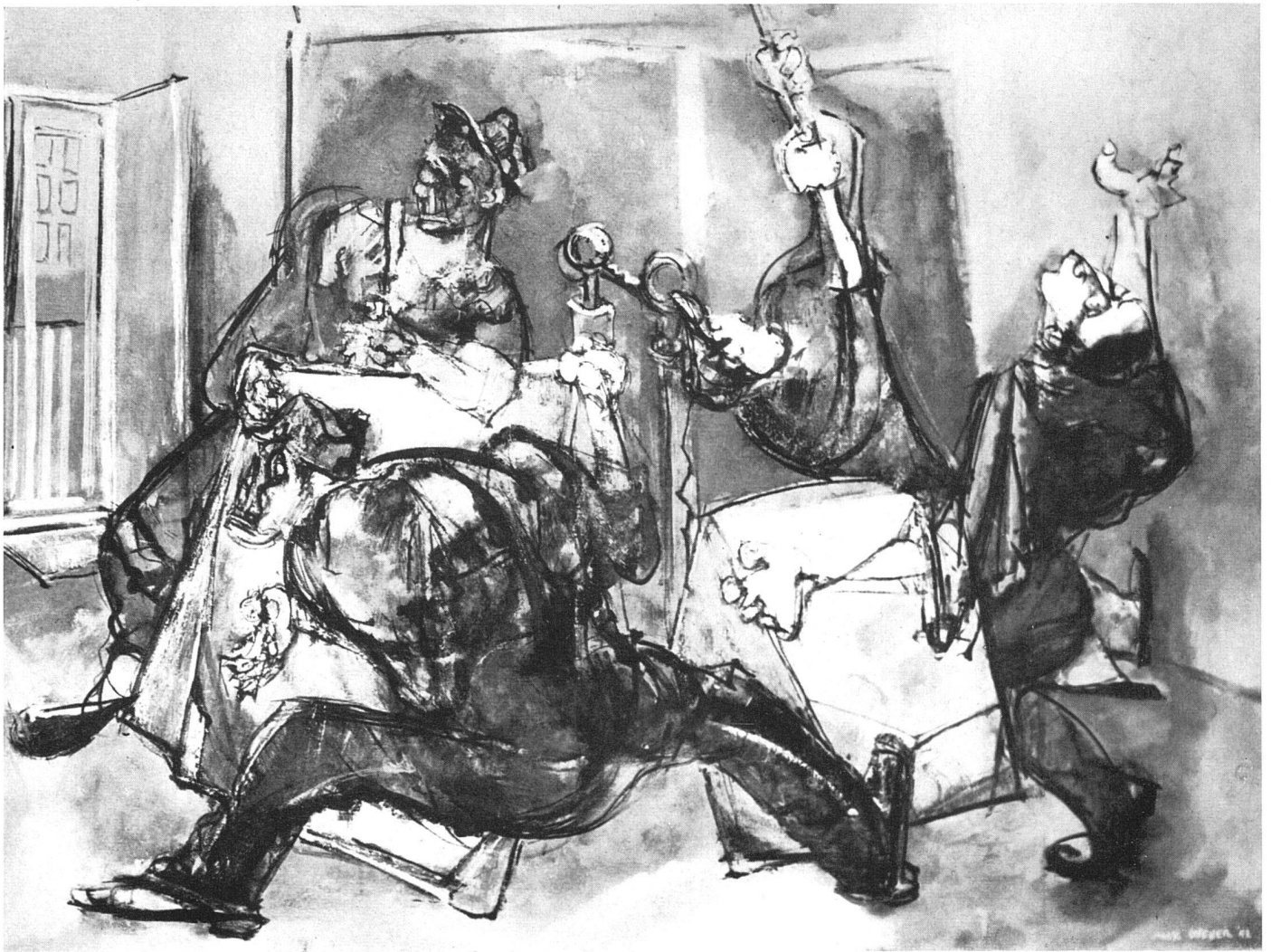
Max Weber, Die Schwerarbeiter , 1942 | Les travailleurs | The Toilers

Kreis der möglichen Motive. So greift Weber zu den fundamentalen geometrischen Figuren, Dreiecken, Quadraten und Kreisen, und vor allem zu der vitalen Kraft der kalligraphischen Linie. Auch die Farbe bekommt jetzt einen neuen Charakter und eine neue Funktion. An die Stelle einer fein abgetönten, verhaltenen Koloristik treten kraftvoll leuchtende Farben in starken, aber immer ausgeglichenen Kontrasten. Am weitesten geht die Abstraktion in den der Musik gewidmeten Bildern; die Malerei gewinnt selbst etwas von Musikalität. In «Wind Orchestra» etwa berühren der straffe Rhythmus in der Anordnung der Figuren und die weithin schwingenden Kurven im Hintergrunde wie Musik.