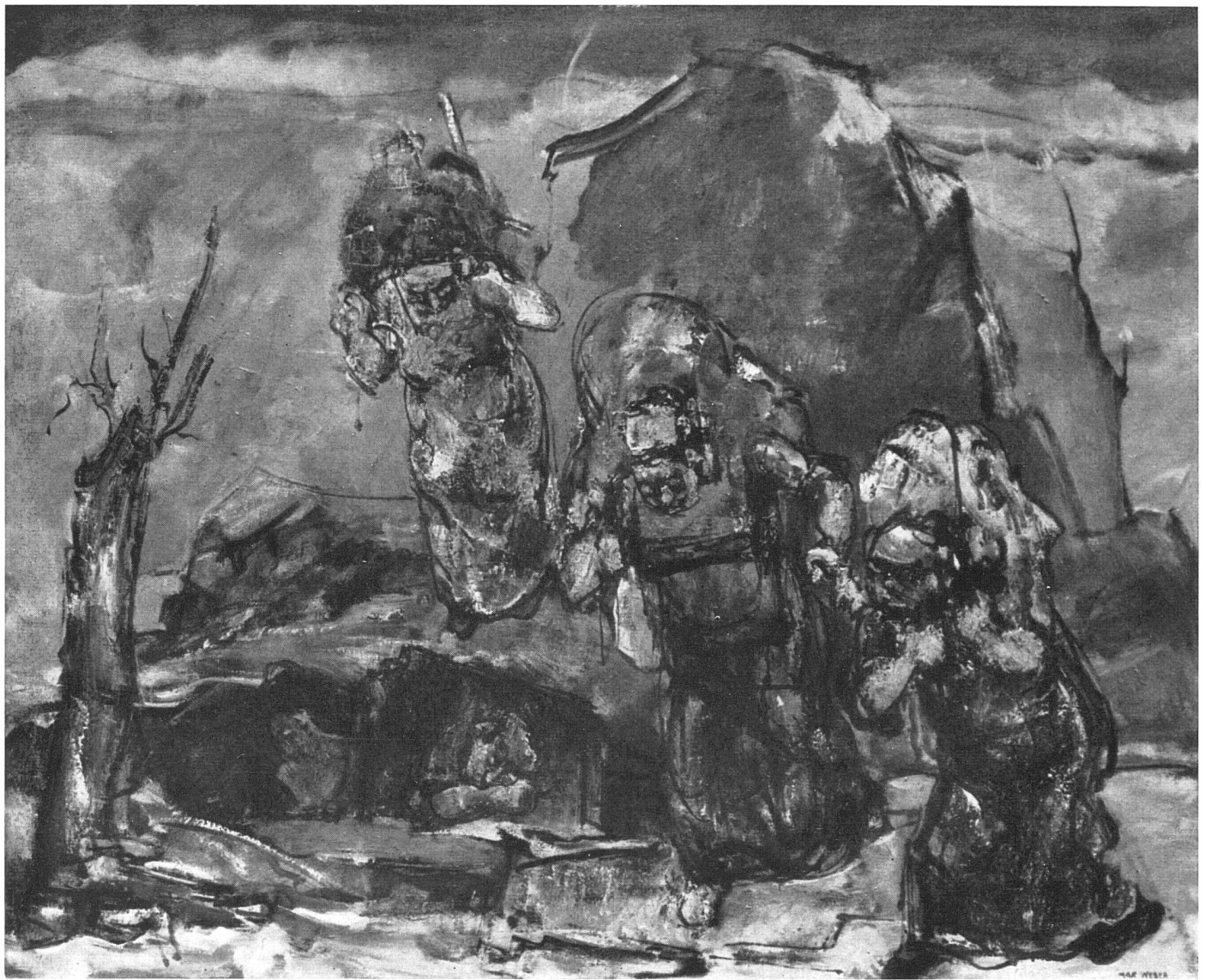
Max Weber, Flüchtlinge , 1939. Sammlung Roland E. Murdock, Wichita Art Museum | Fugitifs / Refugees