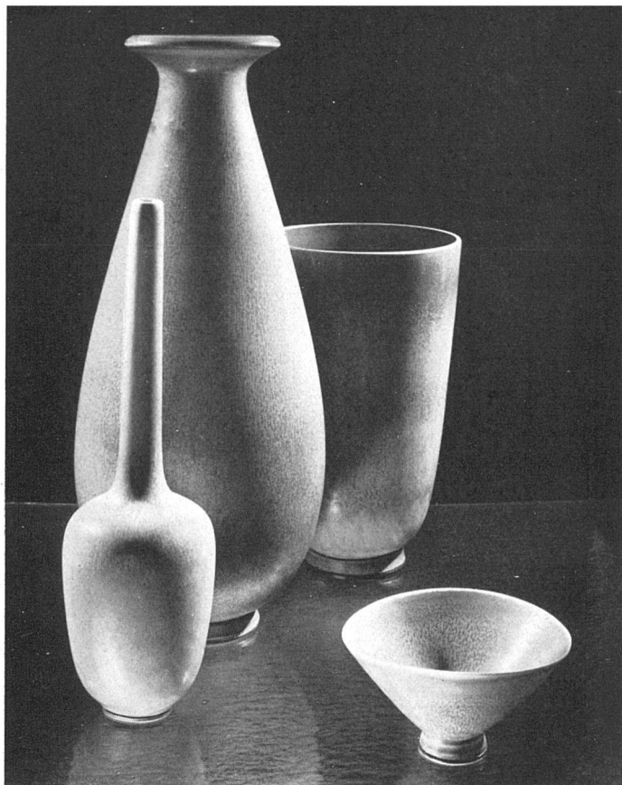
Berndt Friberg, Vasen und Schale in Steingut / Vases et coupe en faïence / Vases and bowl in stoneware. (AB Gustavsbergs Fabriker, «Gustavsbergs Studio»)

diesjährigen Zürcher Schweden-Ausstellung «Vom Eßbesteck zum Stadtplan» steckte zugespitzt den Rahmen ab, in dem sich diese Arbeiten bewegen; Arbeiten, von deren gegenwärtigem Stand die Ausstellung eindrücklich Zeugnis ablegte.