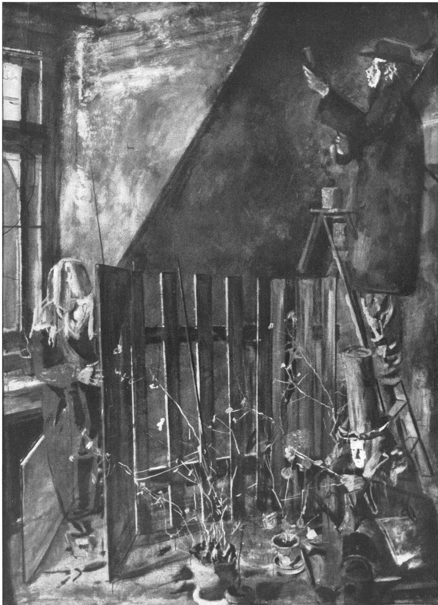
Martin Lauterburg, Wintergarten / Jardin d'hiver / Wintergarten