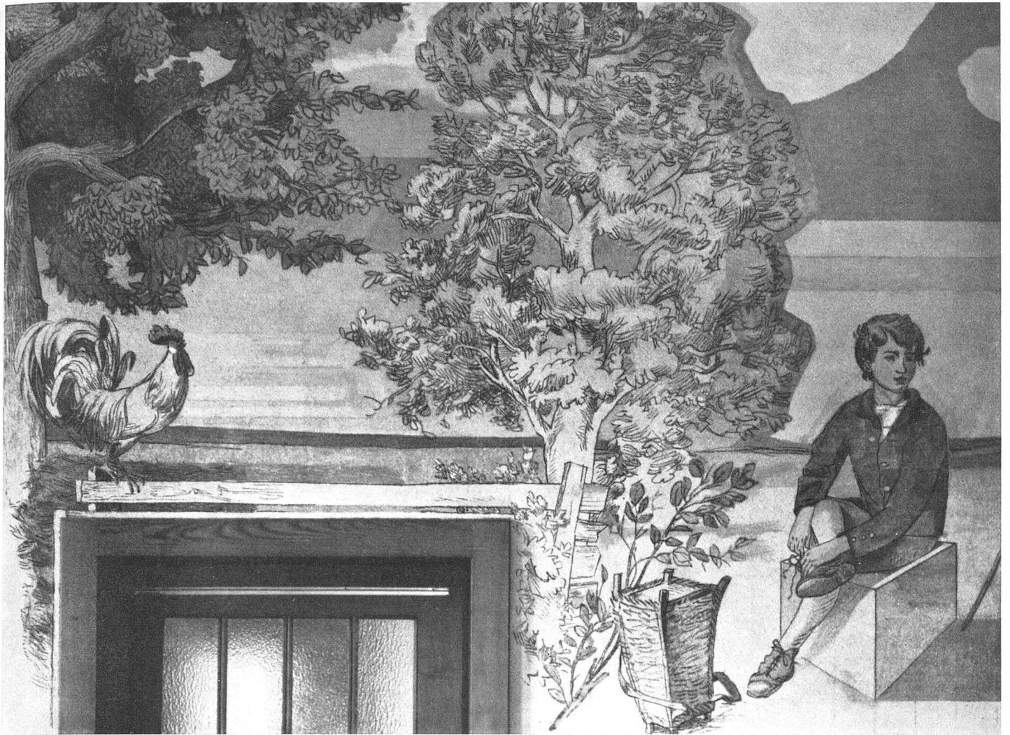
Ernst Georg Rüegg, Detail aus den Wandmalereien / Detail de fresque / Detail of the mural paintings