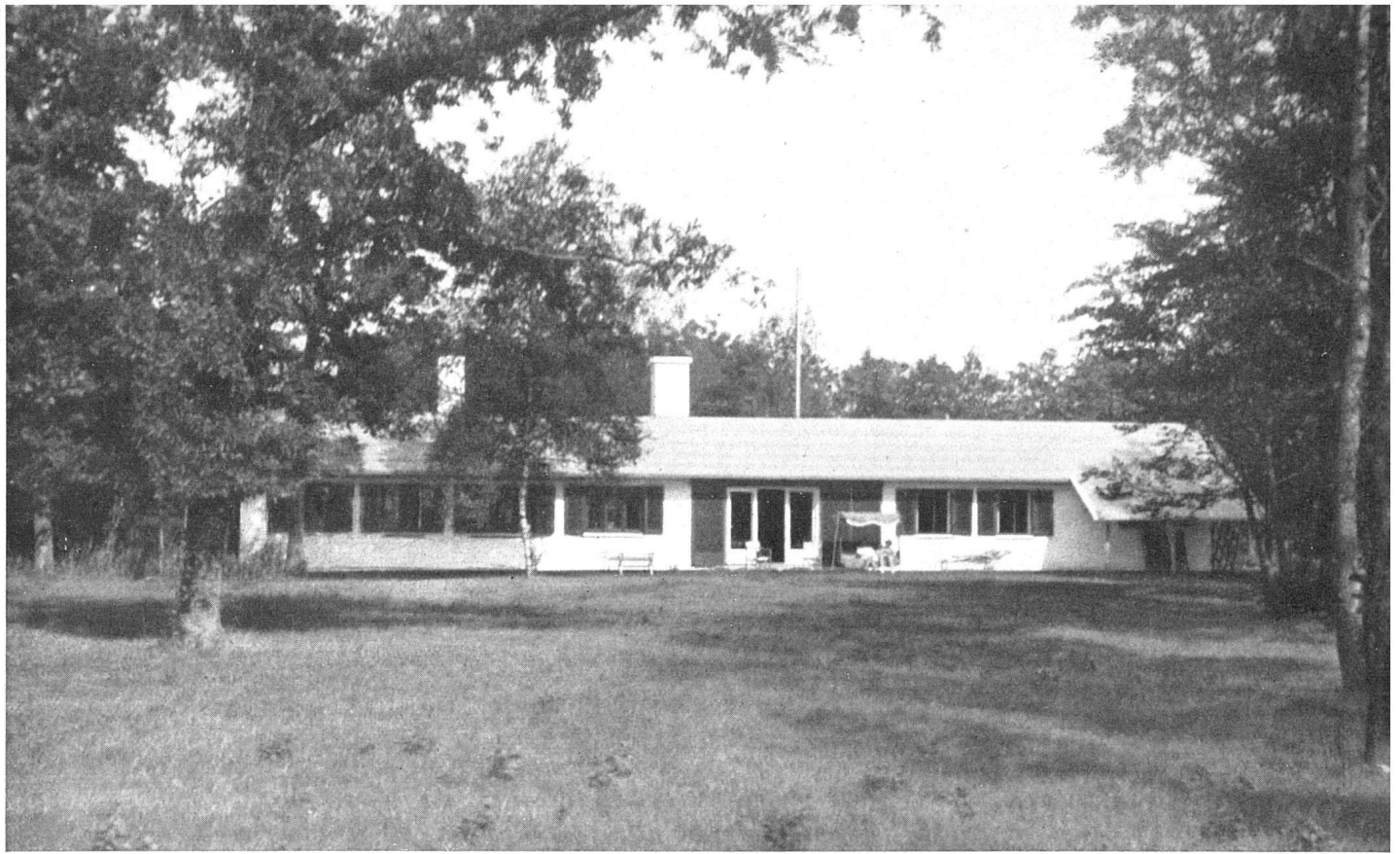
Südansicht | Façade sud | South elevation