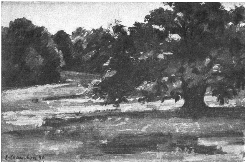
Emile Chambon, Le Chêne , 1946.