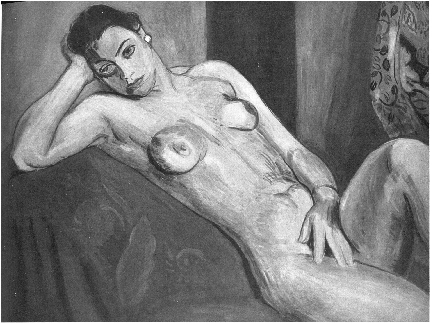
Hans Purrmann, Liegender Akt , 1938 | Nu | Reclining Nude

unruhigt und aufregt.» Er will, «daß der müde, angestrengte, abgehetzte Mensch vor der Malerei Ruhe und Erholung genießt.»