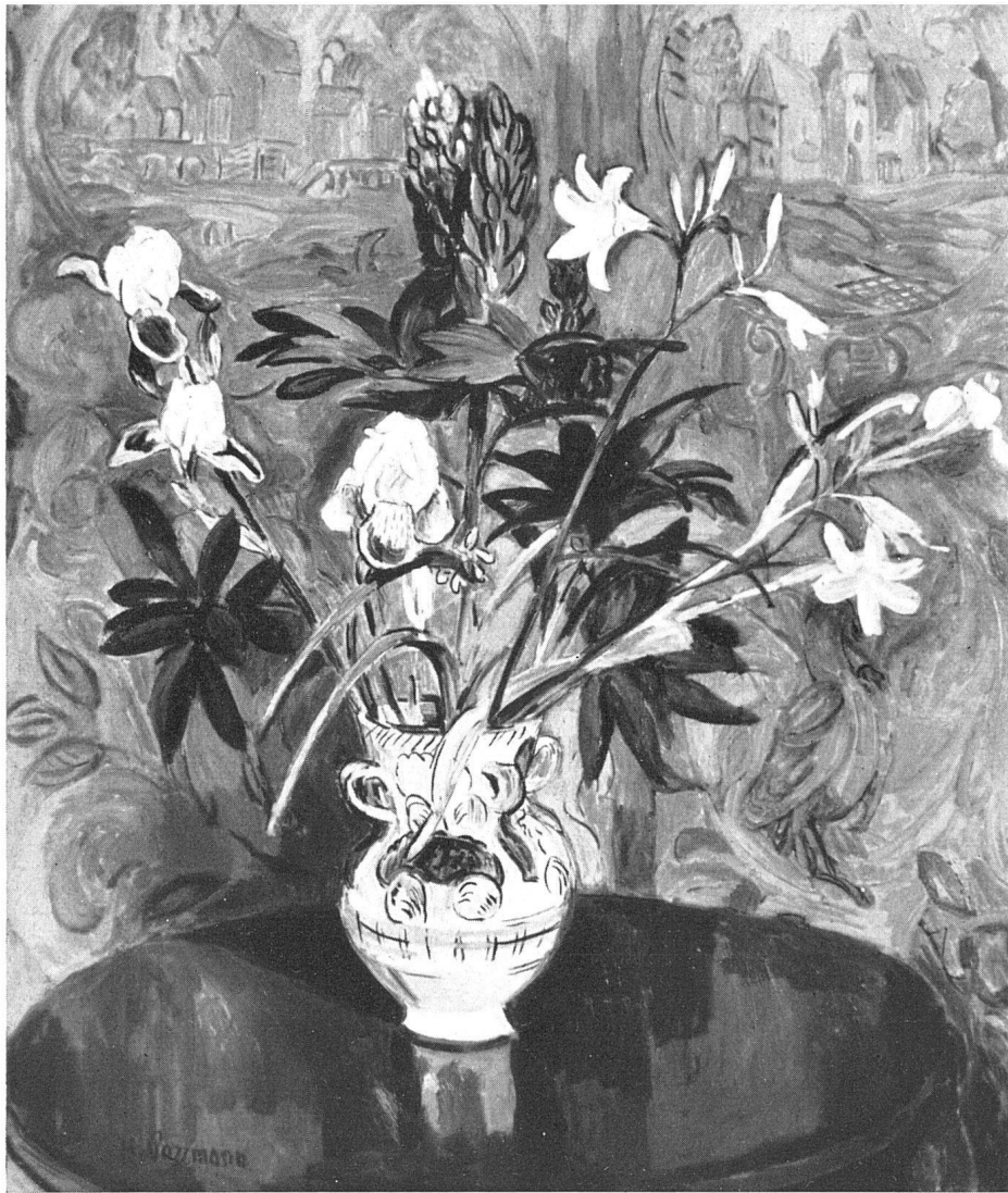
Hans Purrmann, Blumen , um 1928 | Fleurs | Flowers

östlichen Einflüssen willig geöffnet, suchen in leidenschaftlicher Erregtheit das Wesen der Dinge hinter der Erscheinung. Das Religiöse, Psychologische, Philosophische – Gedanke, Gefühl, Deutung – werden mit den Mitteln symbolhafter Steigerung der Farbe und unbekümmerter Deformation, ja Verneinung und Abstraktion, der Natur gesehen und ausgedrückt. In leidenschaftlicher Berufung auf die neue Einsicht und auf die Erkenntnisse der Anreger Cézanne und Matisse setzt sich diese Bewegung im Laufe der ersten Jahrzehnte unseres Jahrhunderts gegen alles Traditionelle hart ab, um schließlich – wie wir heute erkennen – in eine große Gefahr abzugleiten. Diese Gefahr, von der um der Kunst willen gesprochen werden muß, manifestiert sich in einem spürbaren Rutsch von der Phantasie zur Logik, vom Ausdruck zur Konstruktion, von der Fläche zum Kubus, vom Erlebnis zum Erzeugnis (Ware).