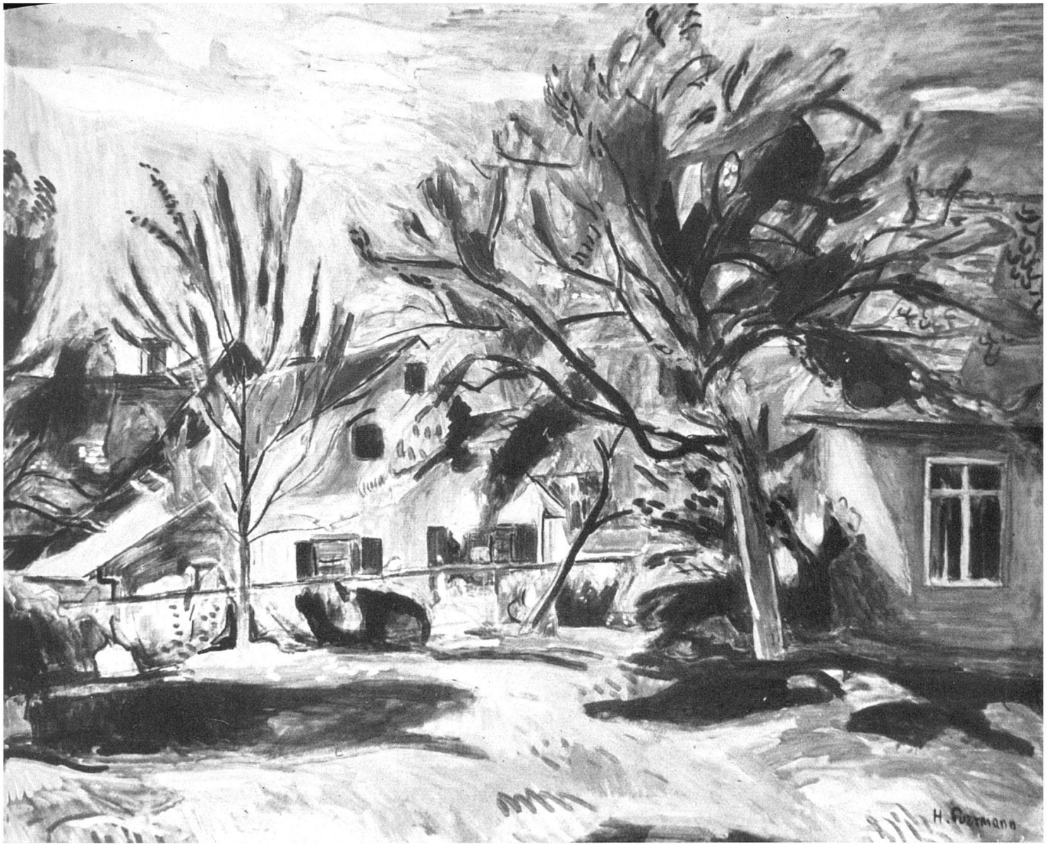
Hans Purrmann, Landschaft, um 1930 | Paysage | Landscape