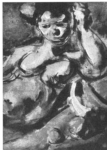
Georges Rouault, Odalisque . Galerie Bing, Paris

treten, und man bedauert, daß er in der Folge in einer oberflächlichen Ausdrucksmalerei seinen Erfolg suchte. Henri Matisse und Rouault sind ihrer eigenen Linie bis heute treu geblieben, und wir erkennen sie ohne weiteres schon in ihren Frühwerken. Ganz besonders Rouault hat sein Lebenswerk, das wir in den verschiedenen diesjährigen Ausstellungen näher kennenlernen, unentwegt in derselben fauvistischen Technik weitergeführt und ihm die Tiefe des reifen Alters gegeben.