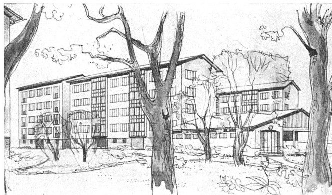
Ansicht aus Südwest

In Ergänzung zu dem Berichte über den Wettbewerb der CIBA AG. zur Erschließung des Horburgareals in Bas- el (siehe «Werk»-Chronik 2/1947, S. *22*) veröffentlichen wir in diesem den Siedlungsfragen gewidmeten Heft die fünf Projekte, da sie eine äußerst wertvolle Ergänzung zu den im Haupt- teil dargestellten Siedlungsfragen bie- ten. Ferner handelt es sich um ein um- fassendes Bauvorhaben eines bedeu- tenden schweizerischen Industriekon- zerns, das an und für sich außerge- wöhnliches städtebauliches und archi- tektonisches Interesse erweckt. Wir verweisen dabei den Leser auf die Ver- öffentlichung des Wettbewerbsergeb- nisses mit der Wiedergabe allerdings nur der drei erstprämiierten Pro- jekte in der Schweiz. Bauzeitung vom 1. März 1947. In der Wiedergabe des