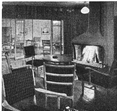
Gesellschaftsraum im Königlichen gymnastischen Zentralinstitut in Stockholm. Architekten: Gunnar Wejke und Kjell Ödeen. Aus «Byggmästaren», 1946/1

Im fünfjährigen Turnus wird die 21. Nationale Kunstausstellung vom 31. August bis 13. Oktober 1946 unter der Leitung des Eidgenössischen Departements des Innern und der Eidgenössischen Kunstkommission in Genf – Kunstmuseum und Musée Rath – durchgeführt. Das Ausstellungsreglement, sowie ein Formular «Vorläufige Beteiligungsanzeige» können ab 25. März 1946 beim Sekretariat des Eidgenössischen Departements des Innern, Bern, bezogen werden.