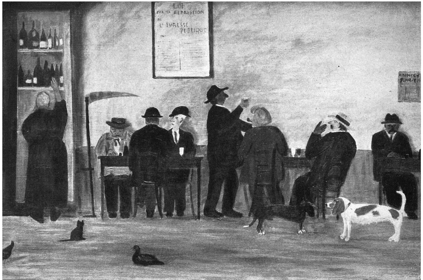
ction particulière, Genève