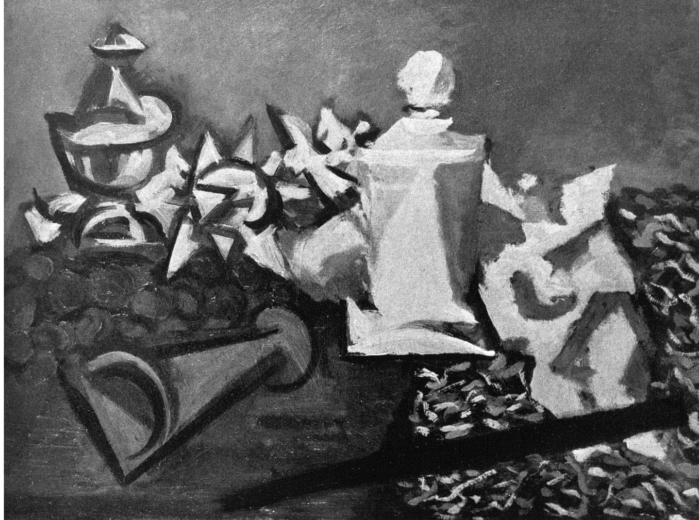
... P. Boissonnas, Genève