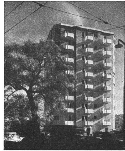
Schwedisches Wohnhochhaus («Punkthaus») in Stockholm. Architekten: Sven Backström und Leif Reinius. Aus «The Architects' Journal» (London), 15. August 1946

Studi . Mailand. Gegründet und redigiert von einer Gruppe der Associazione Libera Studenti Architetti. Verantwortlicher Redaktor: Arturo Morrelli. (neu)