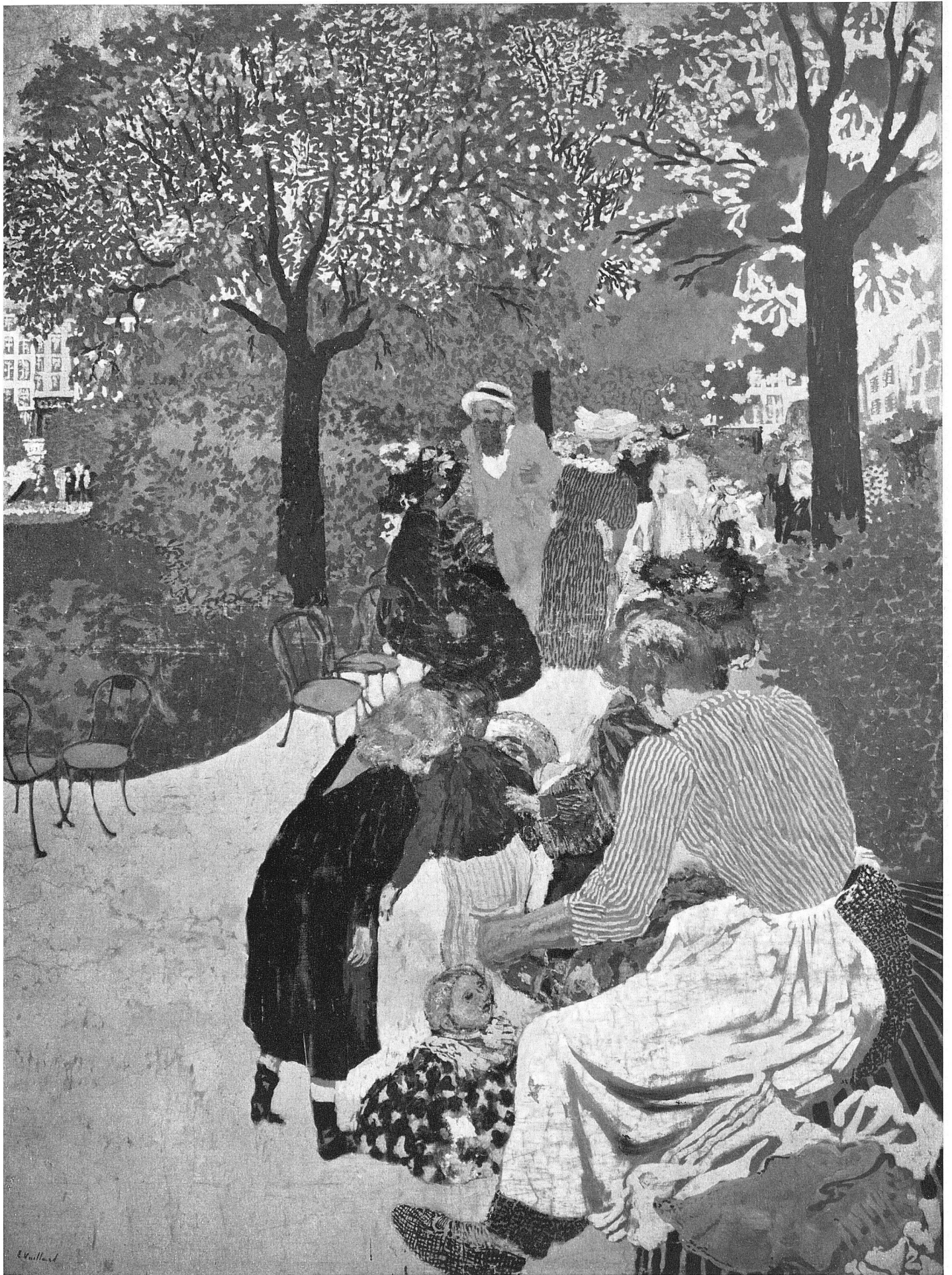
Édouard Vuillard Le Square Vintimille