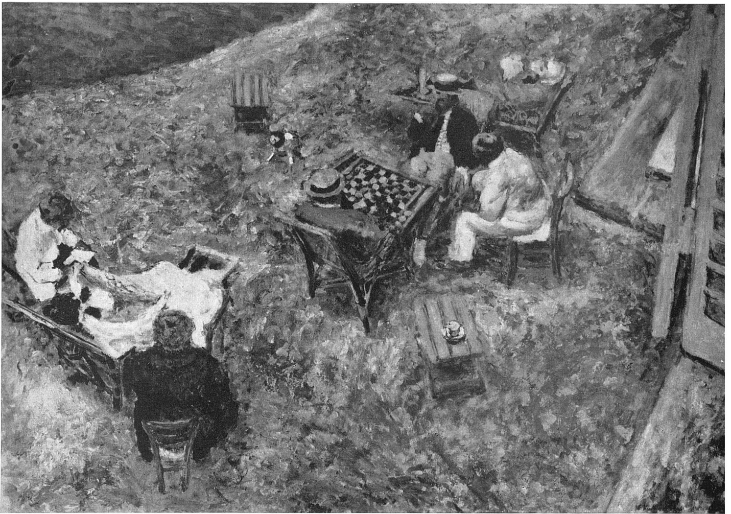
Édouard Vuillard La Partie de Dames 1906