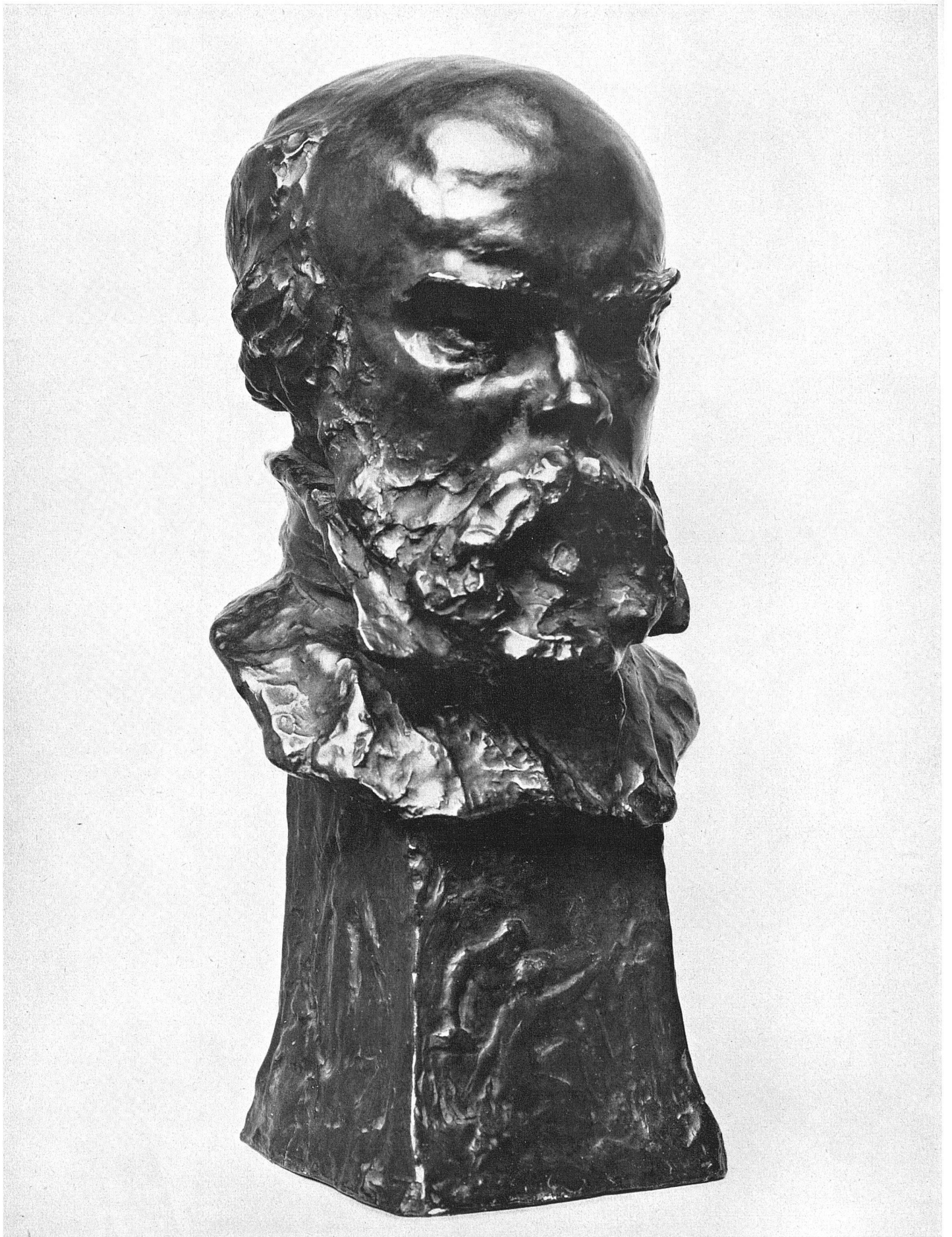
Rodo von Niederhäusern Paul Verlaine Bundesdepositum im Kunstmuseum Basel