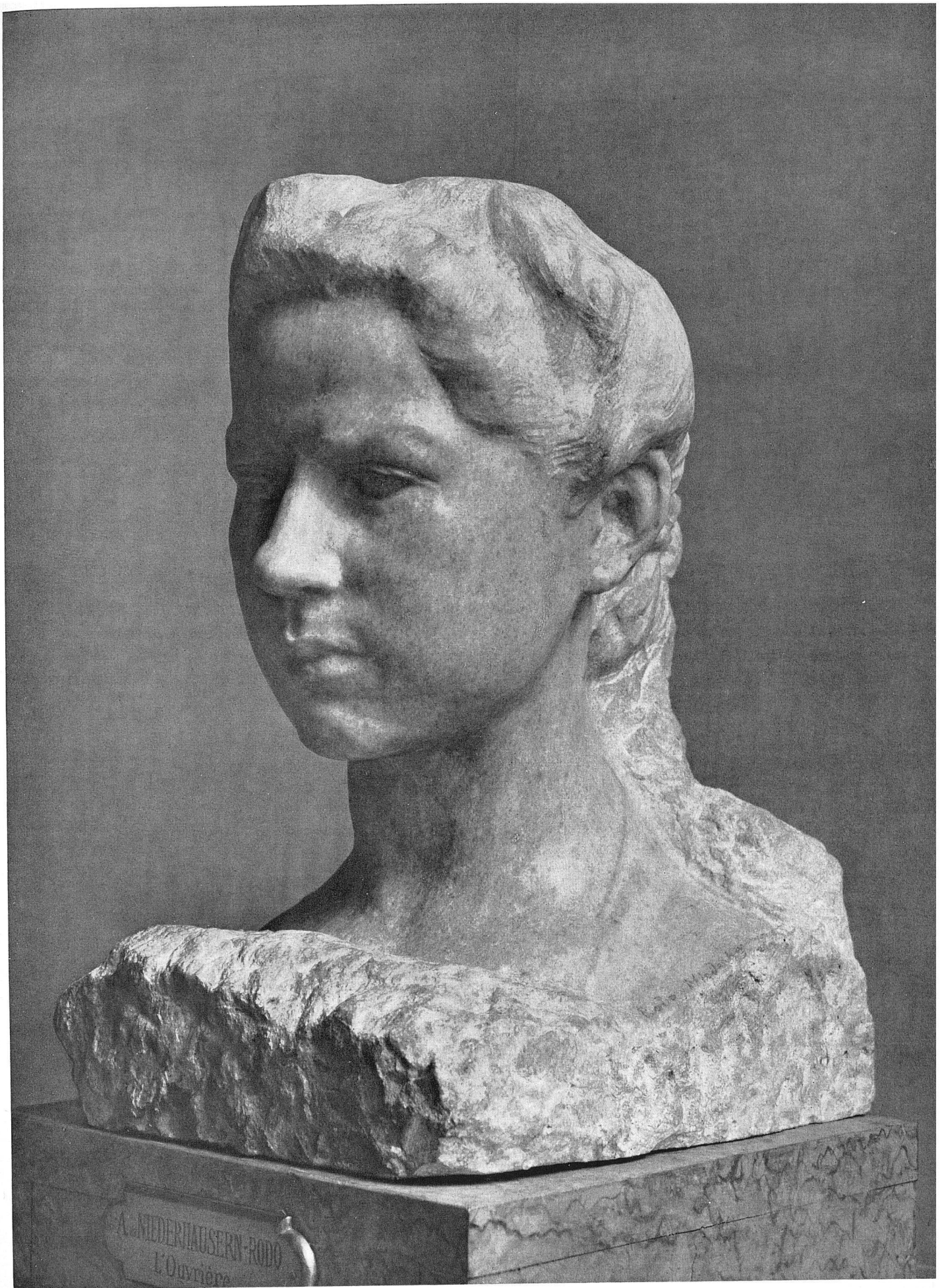
Rodo von Niederhäusern L'Ouvrière Genf, Musée d'Art et d'Histoire