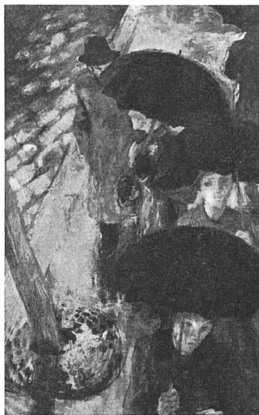
Stefan Szönyi Regen

Daß damals nicht unmittelbar ein Erfolg seiner Malerei in Erscheinung trat, hat Szinyei zur Abkehr von ihr getrieben; enttäuscht zog er sich auf sein Gut zurück. So war es ihm auch nicht vergönnt, einen Einfluß auf die ungarische Malerei auszuüben. Die ungarischen Künstler sind dann, Ende der achtziger Jahre, auf der Pariser Akademie Julien mit dem Stil von Bastien-Lepage in Berührung getreten, und die ganze dort studierende junge ungarische Malergeneration ließ sich von ihm mitreißen, wenn auch der späte, weichere und müdere Naturalismus dieses französischen Malers nicht an die kräftige, leidenschaftlich kühne Weise eines Courbet heranreichte. Zu Beginn der neunziger Jahre standen die meisten begabten ungarischen Maler in der Gefolgschaft der ein wenig trockenem, präzisierenden, blassen